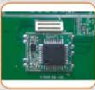
公安部三所移动终端加密模块